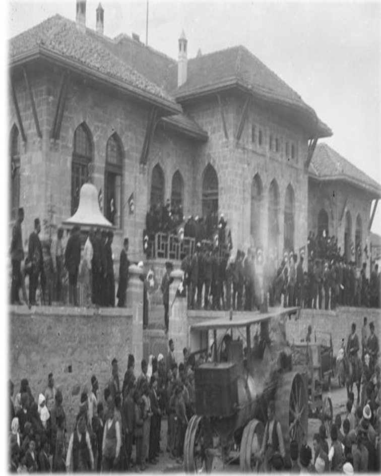
Ankara'da TBMM Binası