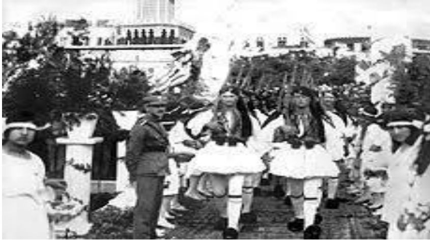
İzmir'de Yunan Askerleri