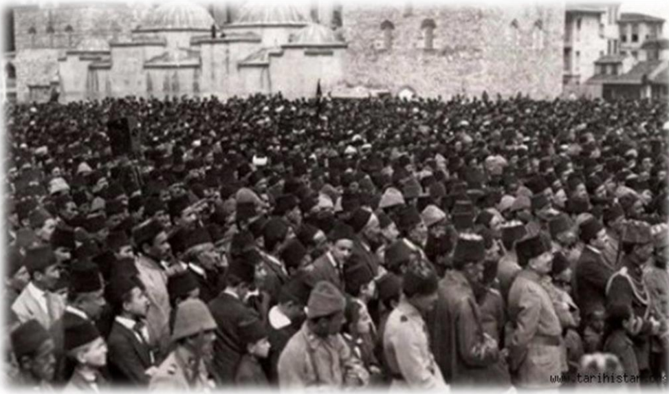
İřgale karřı Sultanahmet Mitinginde Halide Edip (Adivar)