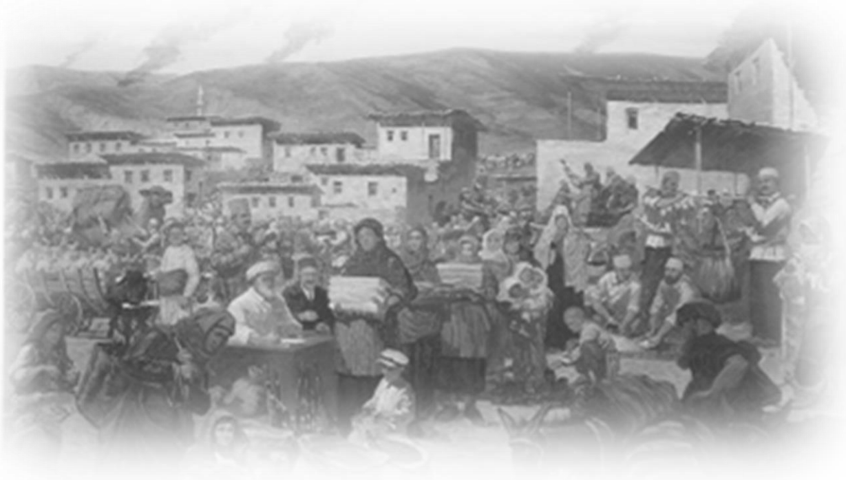
Tekalif-i Milliye Emirlerinin Uygulanışını Anlatan Bir Tablo