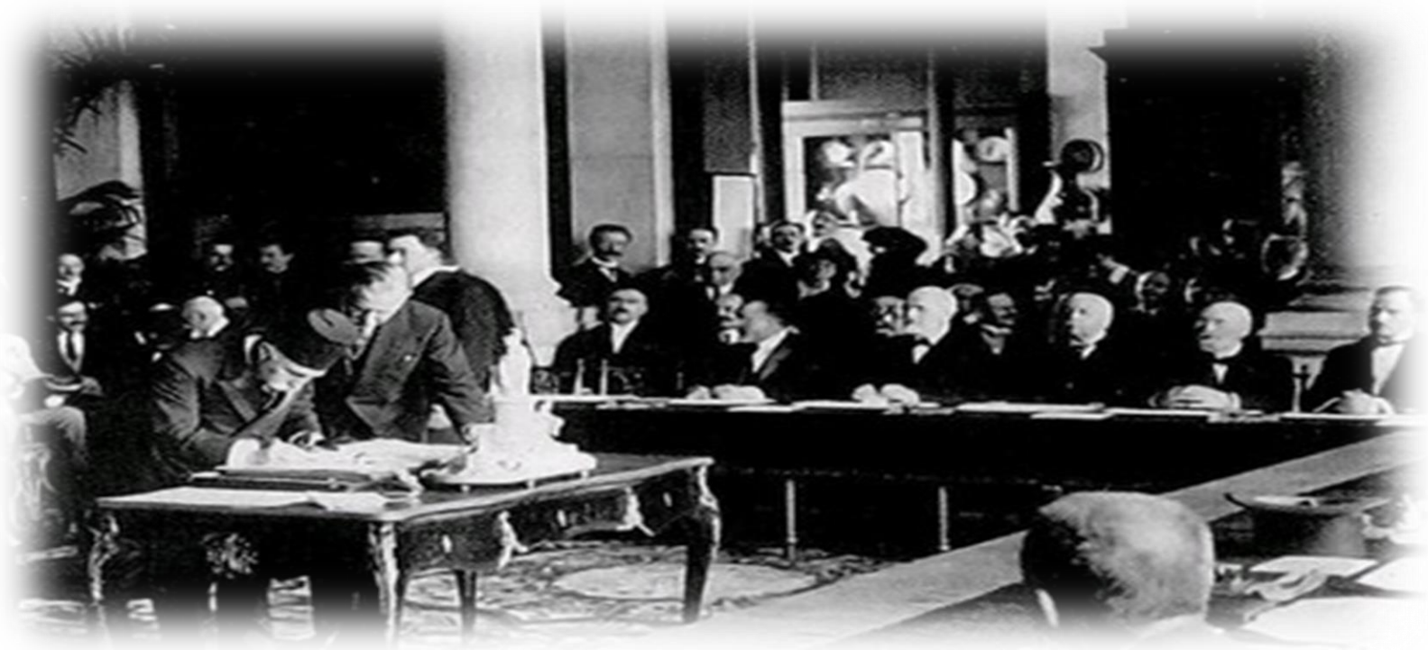
Sevr Antlaşması imzalanırken